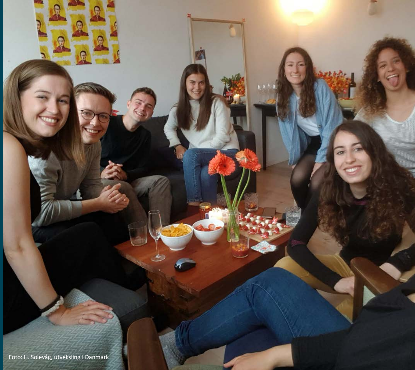
utveksling i Danmark