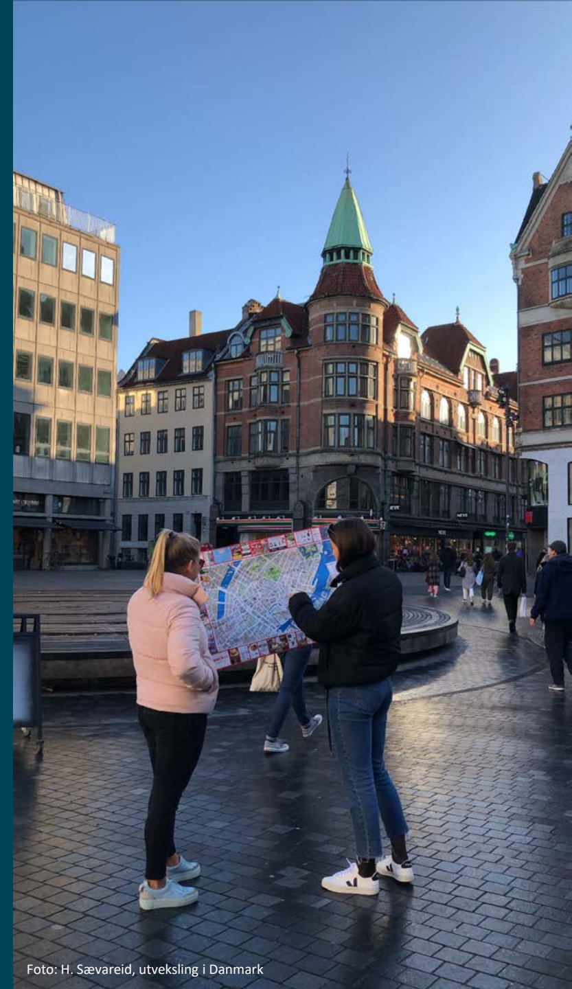
utveksling i Danmark