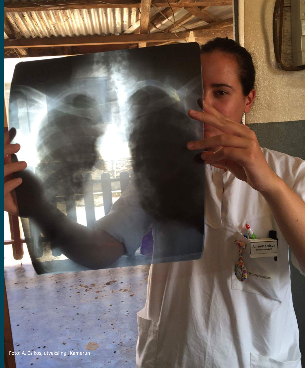
utveksling i Kamerun