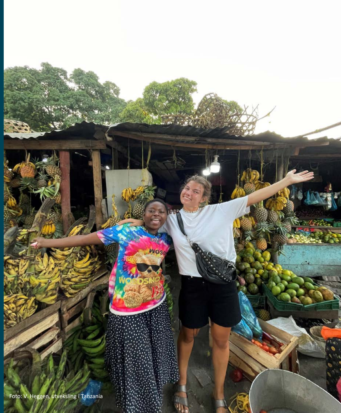
utveksling i Tanzania