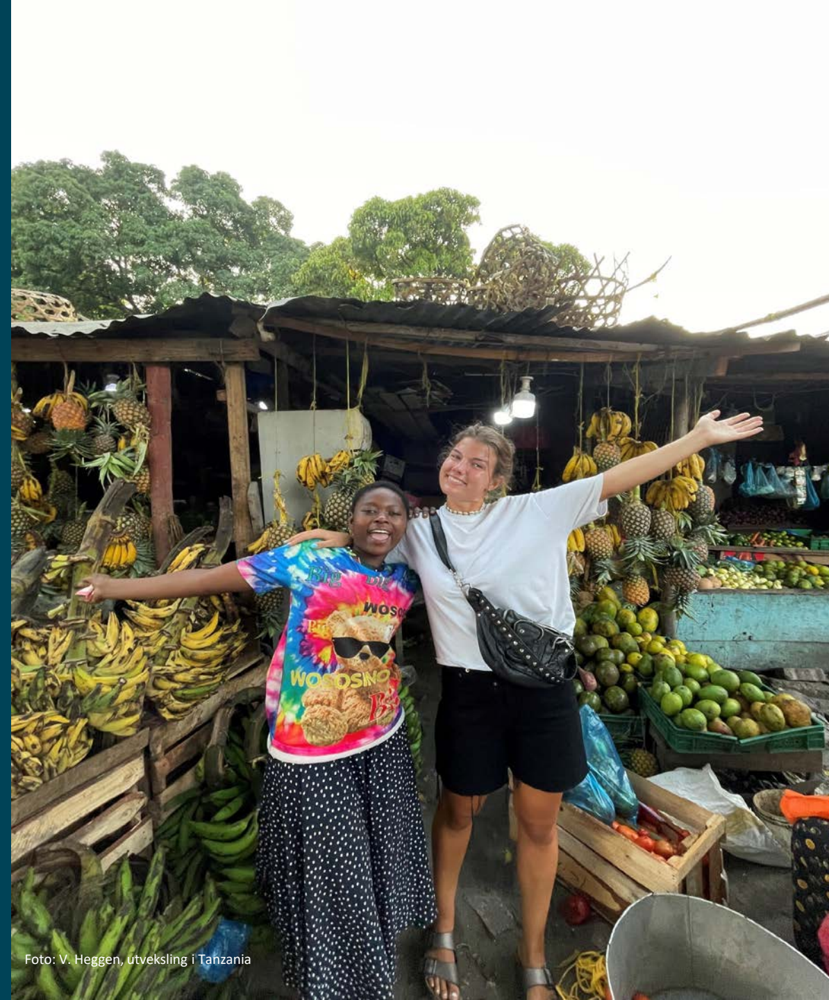
utveksling i Tanzania