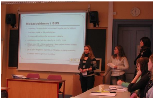
BUS-presenterer egen virksomhet

I 7-8 mars avholdt BUS en to dagers samling for de øvrige DUS kontorene i landet. Deltakere fra Stavanger og Oslo var tilstede på samlingen. Se omtale på HiB-web.